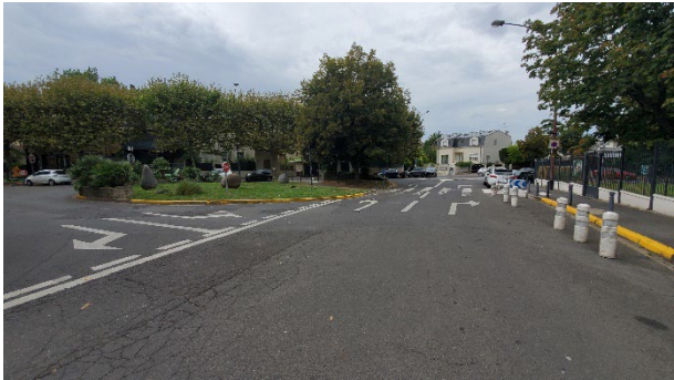
Tronçon démonstrateur des Lilas, rue Paul Langevin : à gauche, avant, à droite, après aménagement